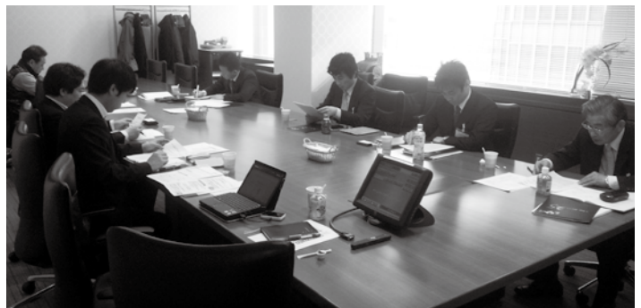
第14回SCM営業戦略本部推進会議